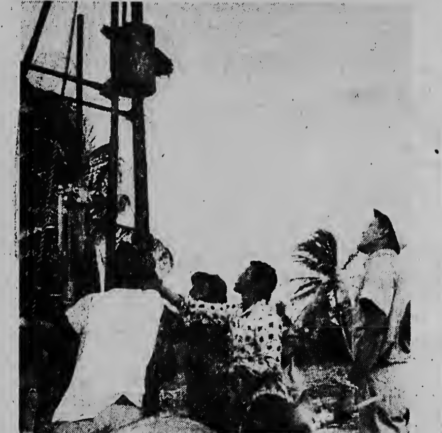
E tubo di bora ta worde bati den suela. Hopi man ta haci e trabao mas liber.